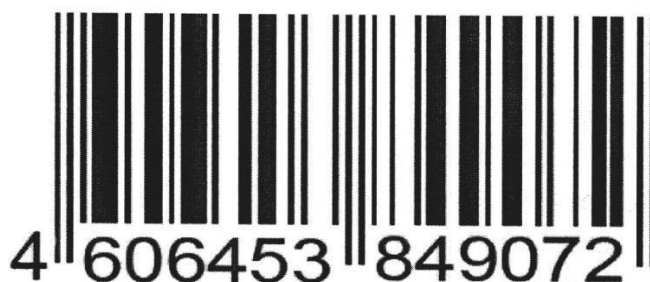
Рисунок 1 – Штрих код

Определение подлинности товара по штрих-коду международного стандарта