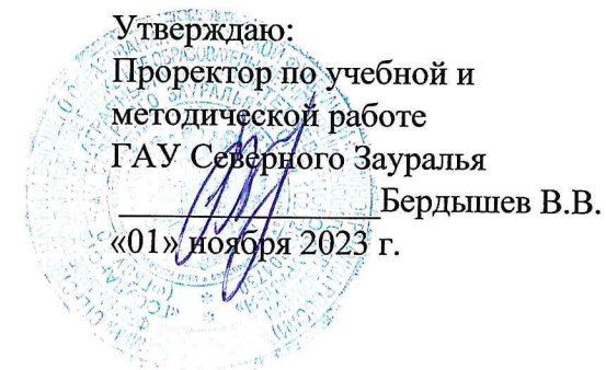
ГРАФИК промежуточной аттестации студентов 1 курса (1 семестр) направления «Биология» магистерская программа «Управление ресурсами животных естественных биоценозов» АТИ в 2023-2024 учебном году. зачётно-экзаменационная сессия с 29 ноября по 9 декабря 2023 г.